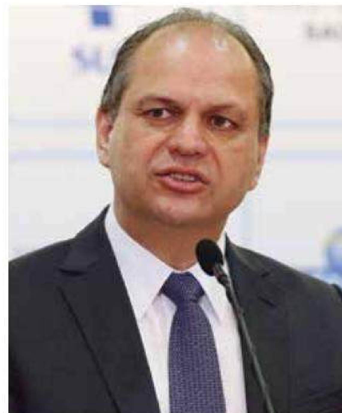
Ricardo Barros, ministro da Saúde: “vamos controlar melhor a epidemiologia”

Os Cartórios de Registro Civil já podem realizar o registro do recém-nascido de acordo com as novas regras estabelecidas pela MP, que também define mudanças para casos de adoção antes da data de registro de nascimento, para o qual poderá haver a opção de naturalidade pelo município de residência do adotante, município de nascimento da criança ou de residência da mãe.