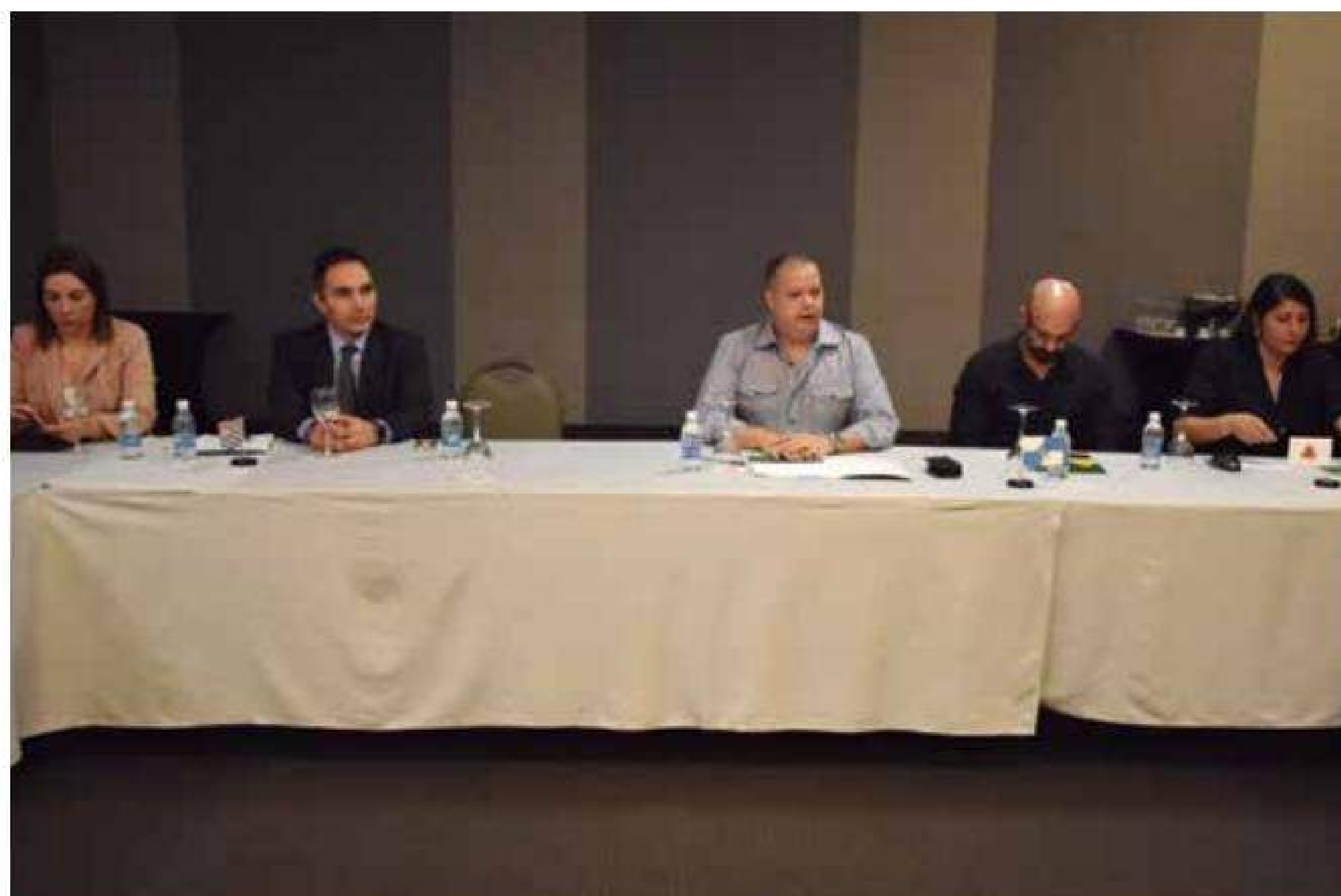
A mesa que coordenou os trabalhos da reunião nacional promovida pela Arpen-Brasil

Também foram definidas ações da entidade relativas ao Projeto Ofício da Cidadania, a criação de um Livro F para registro dos custodiados, ao projeto de Identidade Civil Única Nacional (ICN) e o fortalecimento das Arpens Nacionais. “Vamos pessoalmente visitar todas as entidades estaduais, conhecer as realidades e dificuldades de cada Estado, para que possamos, de forma equalizada, fazer com que todo o Registro Civil evolua de forma contínua e uniforme”, finalizou o presidente.