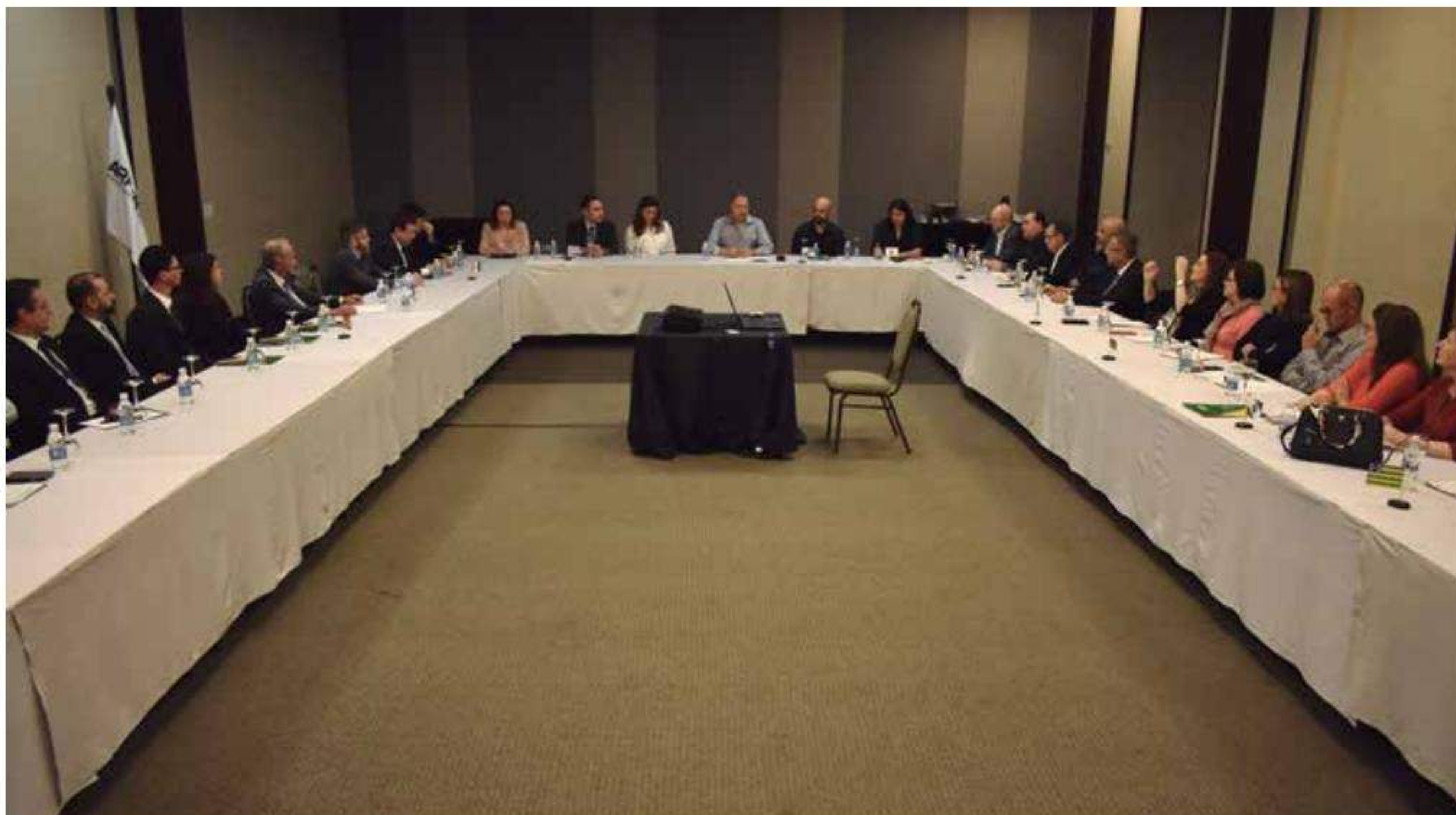
Encontro nacional da Arpen-Brasil reuniu em Brasília diretores do Registro Civil e dos Fundos de Compensação dos Estados brasileiros