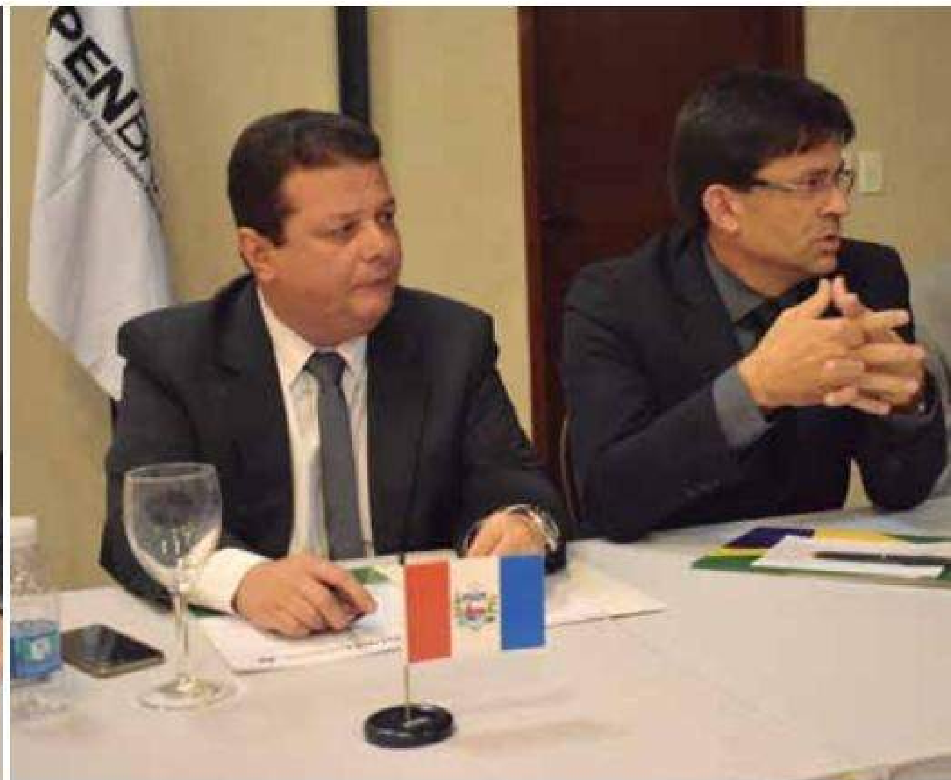
Representantes de diversos Estados brasileiros se fizeram presentes no encontro nacional promovido pela Arpen-Brasil em Brasília (DF)