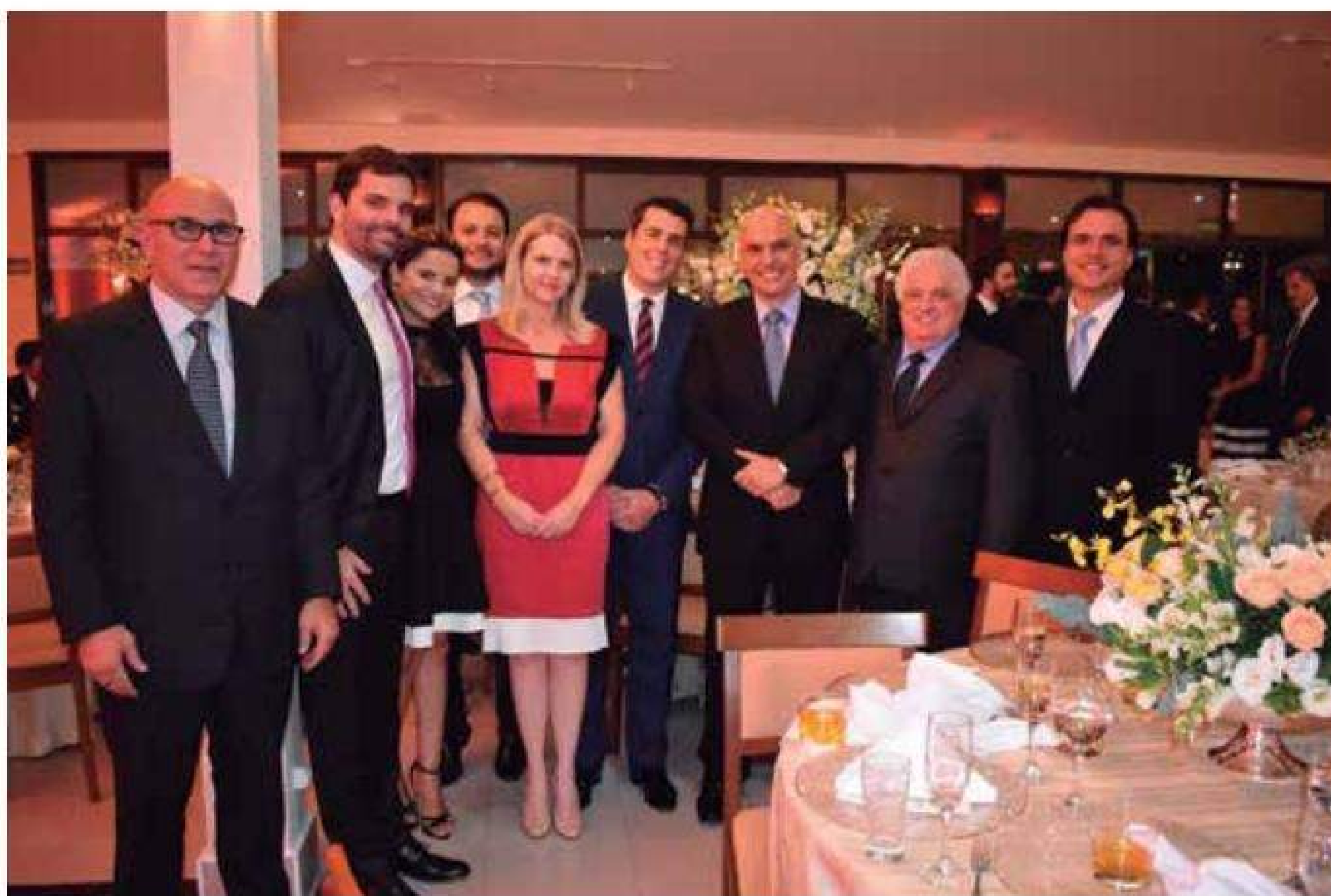
Jantar de posse realizado em Brasília (DF) reuniu diversas autoridades de todos os poderes da República

culdade de Direito da USP e professor titular da Faculdade de Direito da Universidade Presbiteriana Mackenzie. No biênio 2005-2007 foi nomeado para a primeira composição do Conselho Nacional de Justiça.