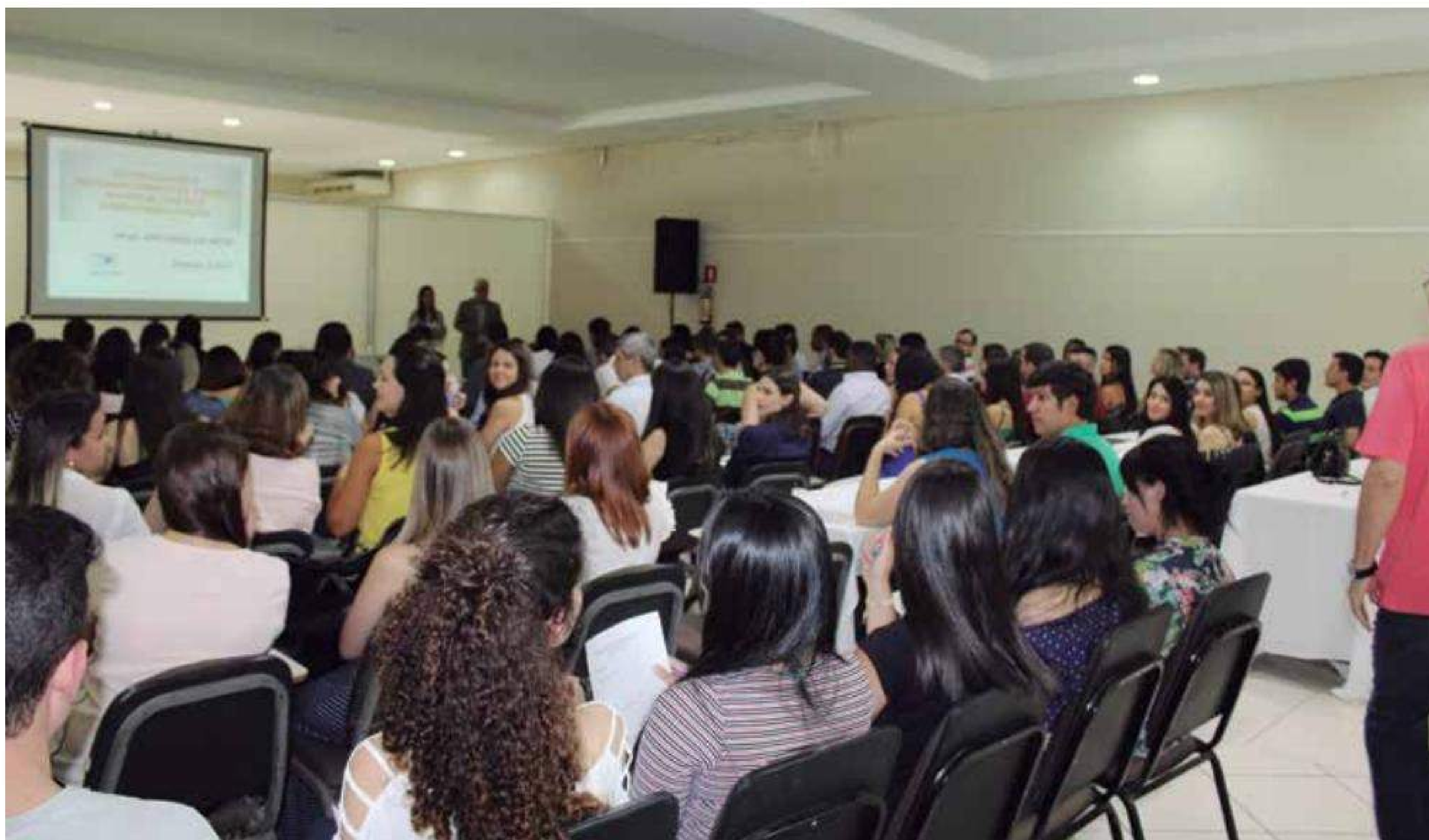
Curso de Autenticação e Reconhecimento de Firmas em Araraquara esteve lotado para a capacitação de funcionários da região

Cidade do interior paulista recebeu 103 participantes da região para debater os principais temas atuais relacionados à categoria