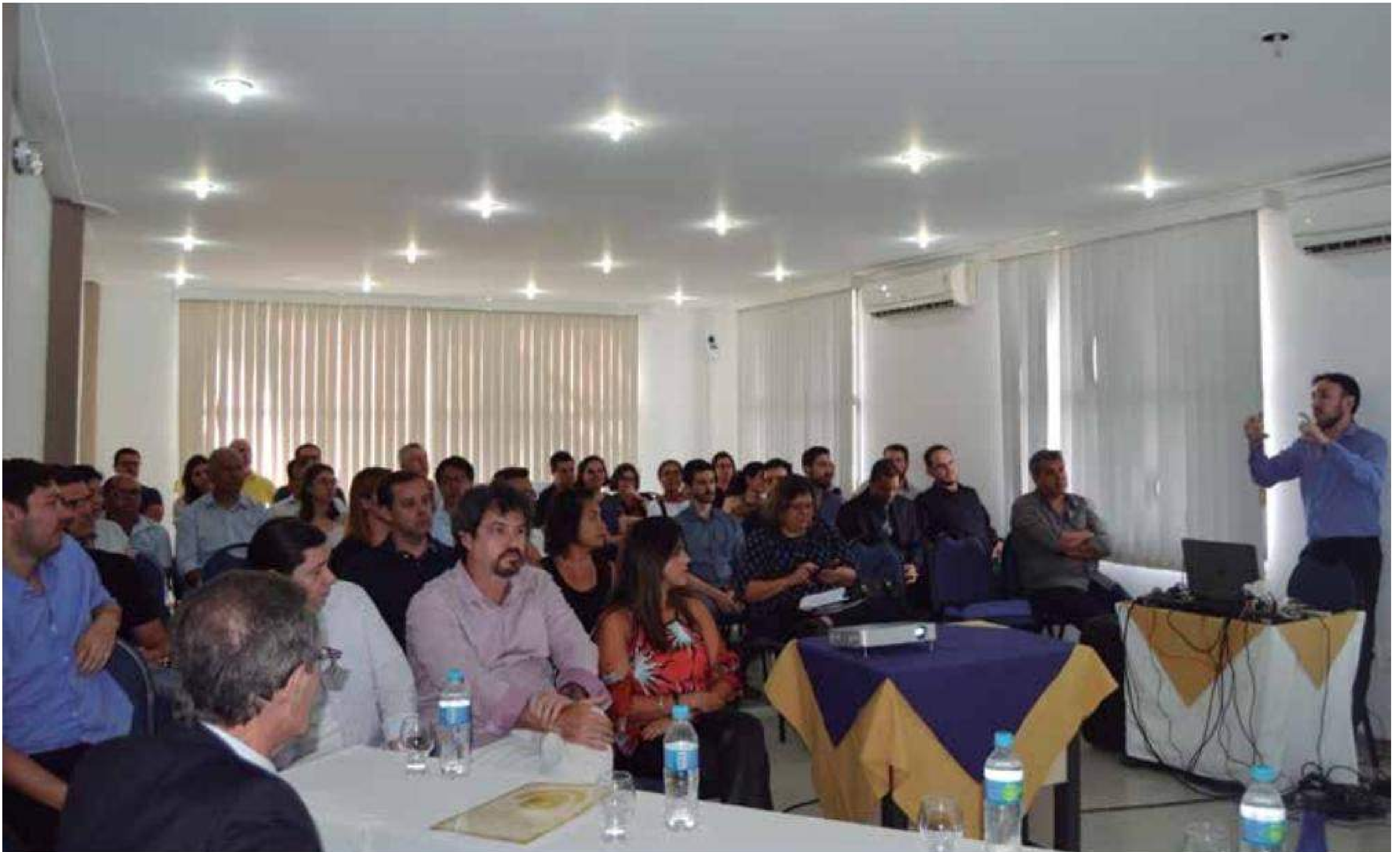
Reunião Regional na cidade de Limeira debateu importantes assuntos do Registro Civil, como a interligação via CRC

Primeiro encontro mensal no interior de 2017 debateu questões referentes ao sistema registral e à gratuidade de serviços oferecidos à população