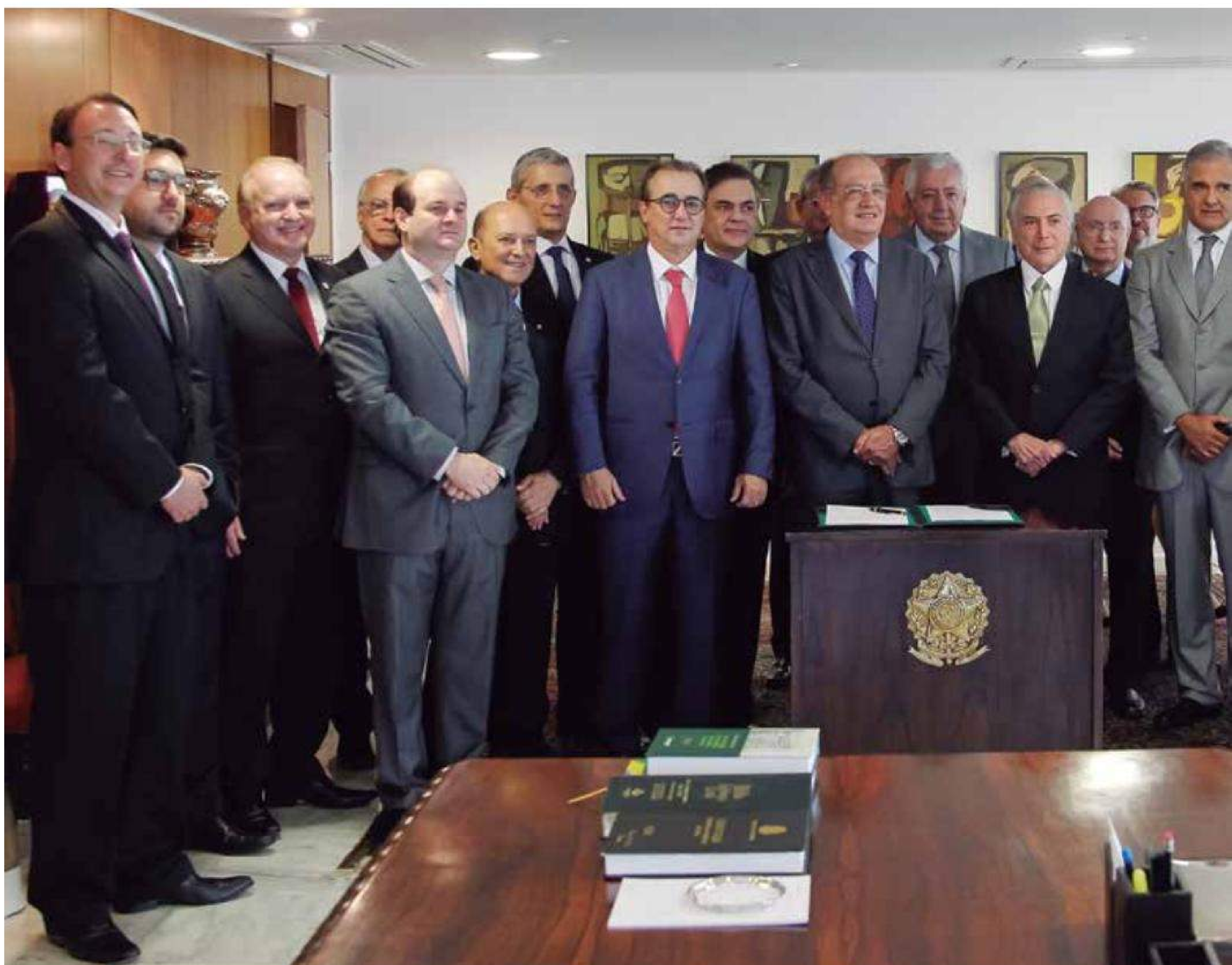
Governo Federal sanciona o projeto de lei que institui o documento único nacional

Embora trate-se de um projeto que desperta – com razão – cuidados e atenção em toda a classe dos registradores civis brasileiros, o próprio nome final do texto aprovado traz em