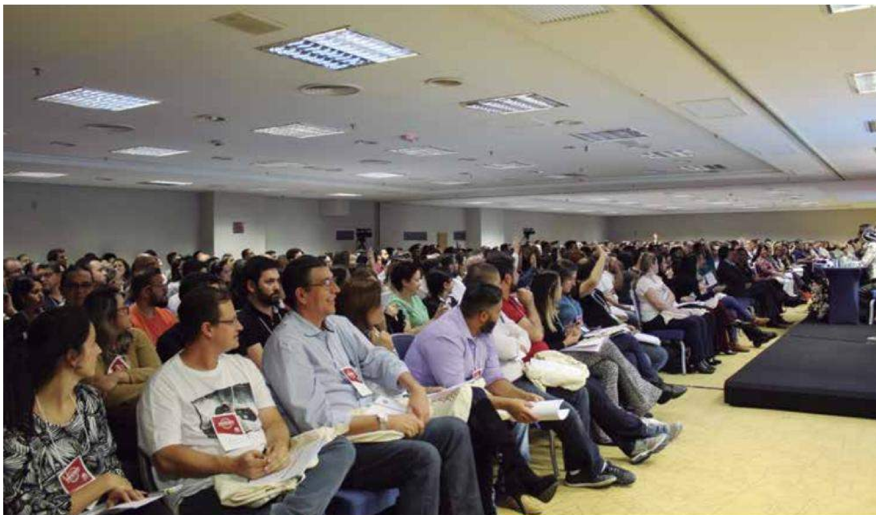
Evento contou com a presença de mais de 430 pessoas que lotaram o auditório do hotel Jaraguá em São Paulo

Evento debateu aspectos da atividade diária dos cartórios em relação ao novo serviço delegado aos serviços extrajudiciais