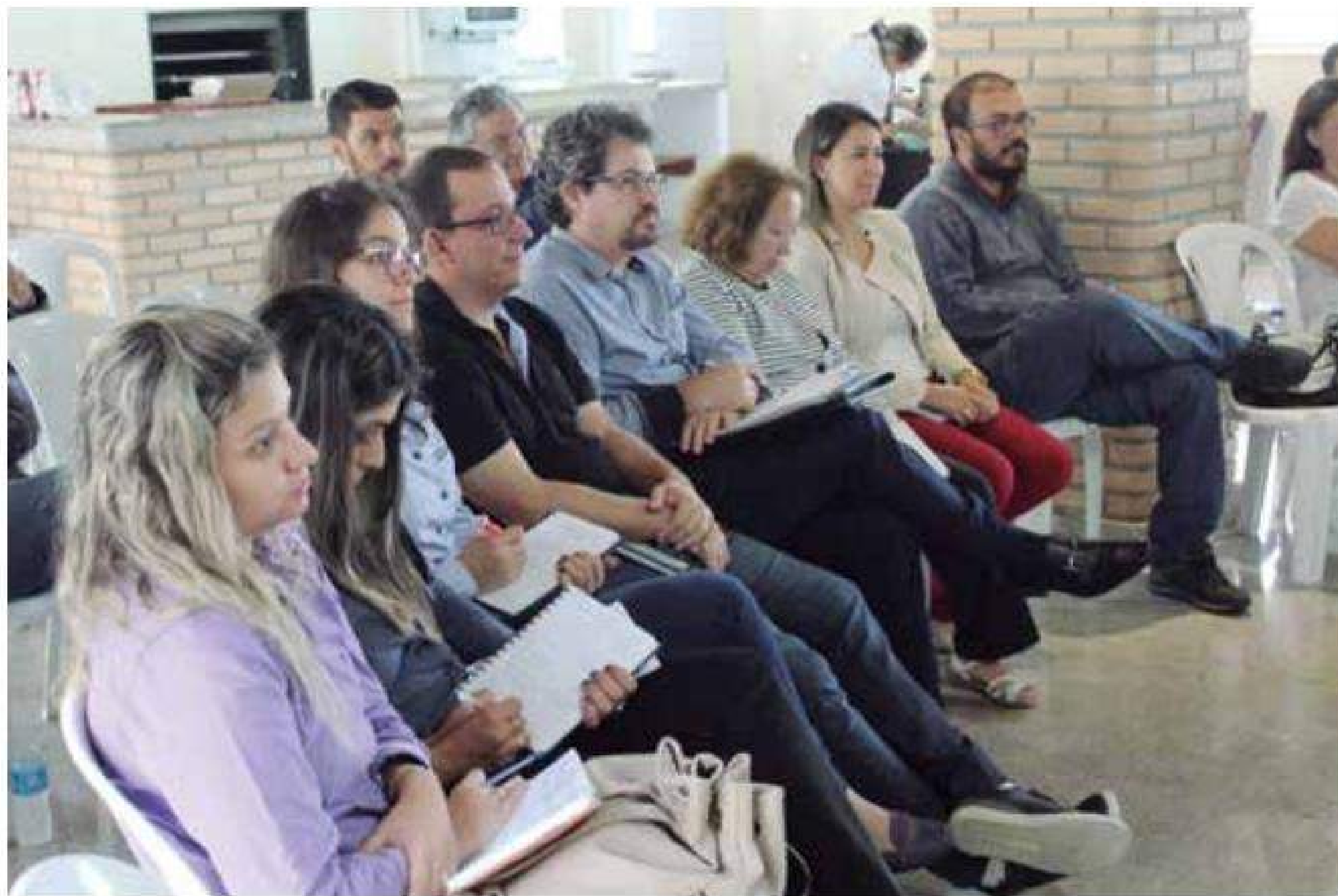
Iniciativa contou com a presença de Oficiais da região, que debateram a padronização de atuação no Registro Civil

Para os que estavam presentes no evento, os painéis agregaram grandes conheci-