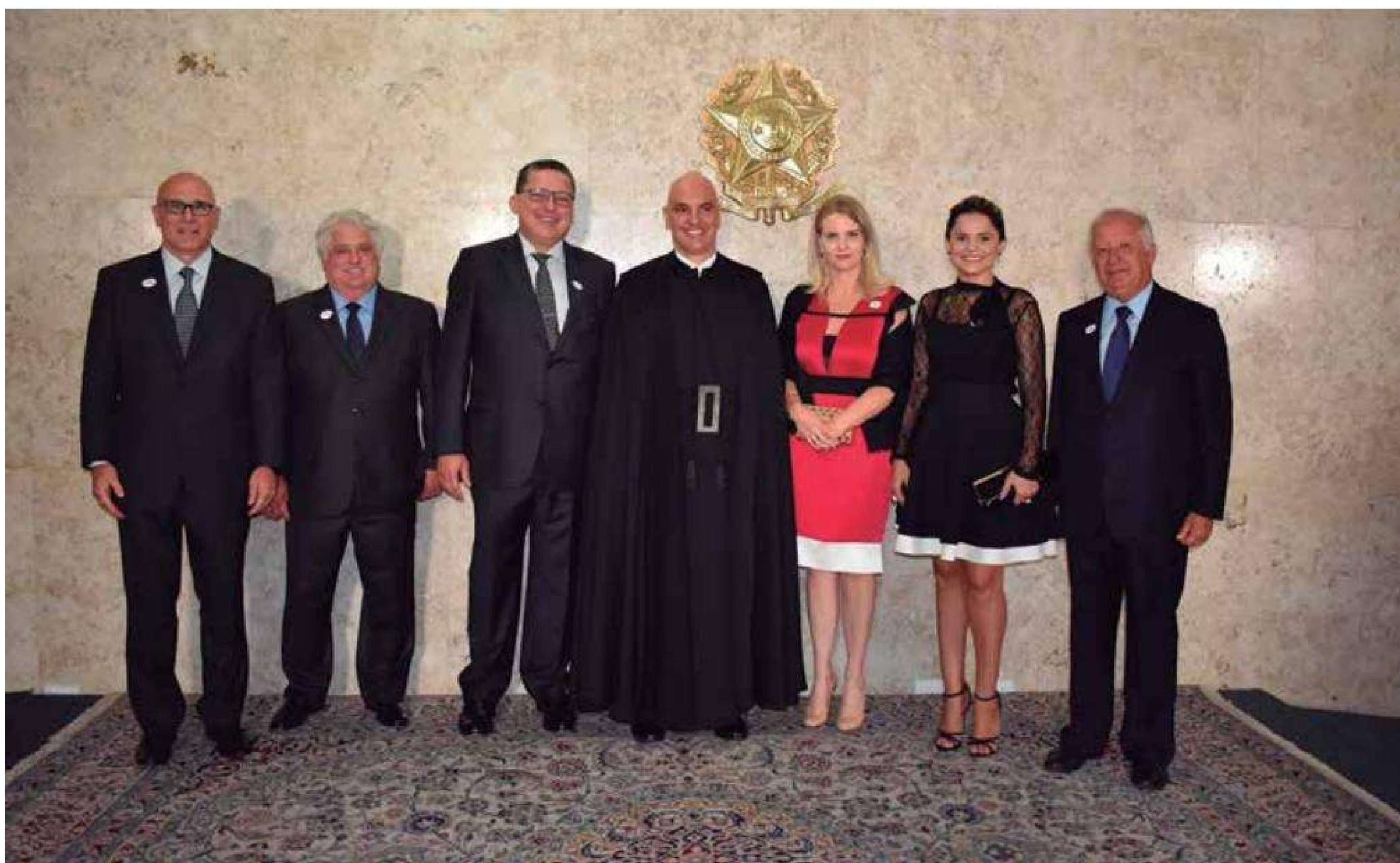
Notários e Registradores posam ao lado do novo ministro do STF Alexandre de Moraes durante cerimônia de posse em Brasília

Presidente da entidade se encontrou com membros do Executivo e Judiciário federal