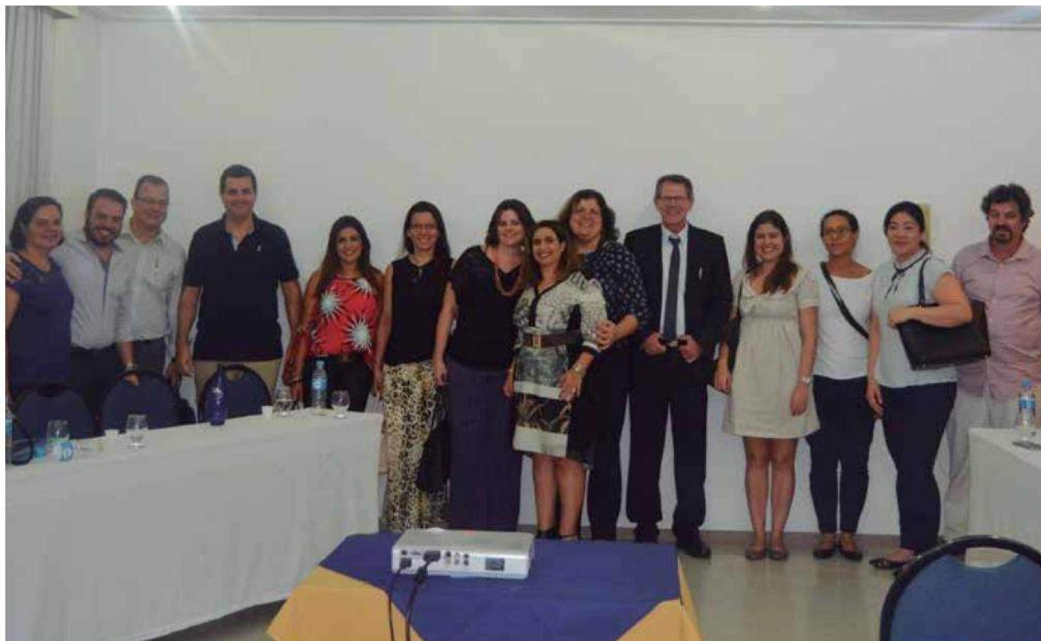
Evento na cidade de Limeira contou com a presença de diversos Diretores da Arpen/SP

Ao final da reunião, foi divulgada a lista de cursos que a Arpen/SP realizará durante o ano de 2017.